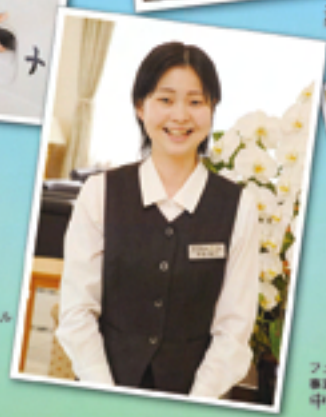
フューネラル 事業部 本田