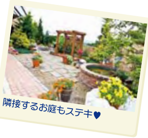
隣接するお庭もステキ♥

ちょっとA子食べすぎじゃないの?! あら、B子こそ、デザート狙いすぎ! まあまあ…いっぱい並んでるんだから 食べただけ食べましょーよ。