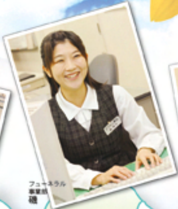
フューネラル 事業部 橋