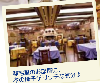
邸宅風のお部屋に、 木の椅子がリッチな気分♪

食いしん坊の私たち、 1,500円で どれだけ幸せになれるか チャレンジします。 気合が入りますよ。