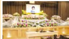
※正面遺影はイベント用の顔写真です。