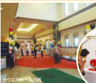
ナウエルホール川西