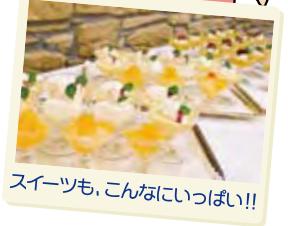
スイーツも、こんなにいっぱい!!

では早速、いただきます。 「美味しいよねえ〜」それも そのはず、ブライダル料理 でウデを振るうシェフが 本格的に作ってるんだもの。 しかも、あったかい料理は あったかいまま!