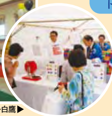
ナウエルホール白鷹▶