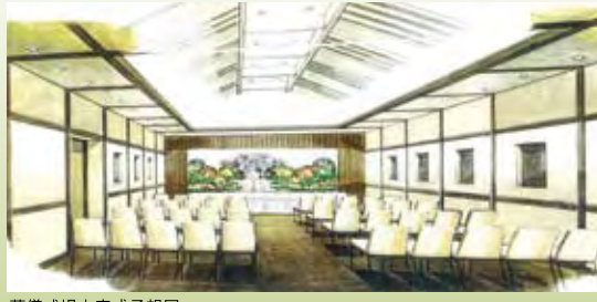
葬儀式場内完成予想図