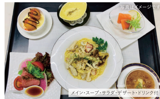
写真はイメージです メイン・スープ・サラダ・デザート・ドリンク付

毎月、限定で開催中のランチフェア! 当日好きなメインメニューが選べるワンプレート料理が楽しめます。お子様ランチもご用意しております。