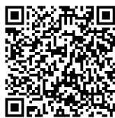
アンケートフォーム