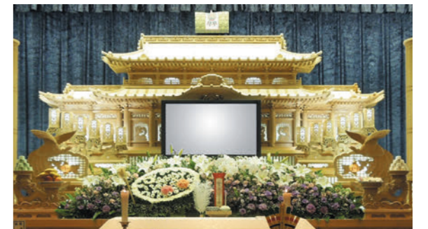
祭壇の生花を、パレットと絵筆を持っているようなイメージでアレンジしました。

「想い出コーナー」は、一般の参列の方はほとんどいらっしゃらないのですが、「叔母はこういう人だった」「こういう事を残してくれた人だった」という事を、葬儀の会場であらためて想い出を語り合いながら目に出来たことは、とてもいいことでしたね。私たちの孫達にも、強く印象に残ったようでした。家族や親族で見送る「家族葬」で叔母と過ごした時間にひとつのけじめという区切りをつけ、また新たに家族の年輪を重ねていくということですね。子ども達の記憶にも残り、折にふれ思い出すことが大切な供養になります。親族からも「いいお葬式だったね」