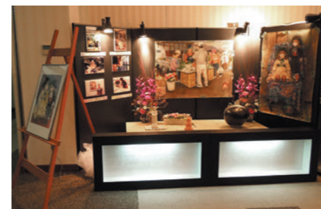
お写真と描かれた絵、創られた焼き物をお飾りしました。絵は二科展で入選されるほどの腕前でした。

葬儀を終えて、「人はそれぞれの最期の送り方があっていいんだ」と強く思いました。明るいなだたら明るい見送り方でもいいんじゃないかなって。亡くなった人の人柄を汲んであげて、家族の想いが叶うお見送りが「家族葬なんだな」と思いました。見送る側の考えがみんな一致していくことは時には難しいかもしれません。本当に「家族葬」でいいのかっていうような意見や迷いもね。でも、患ったり年老いたところをあまり人には見せたくな