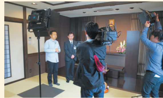
カメラが回り出すと緊張感もピークに。

ゆったりとした空間、便利な設備をご紹介。お通夜だけでなく、少人数様でのご葬儀にもご利用いただいております。