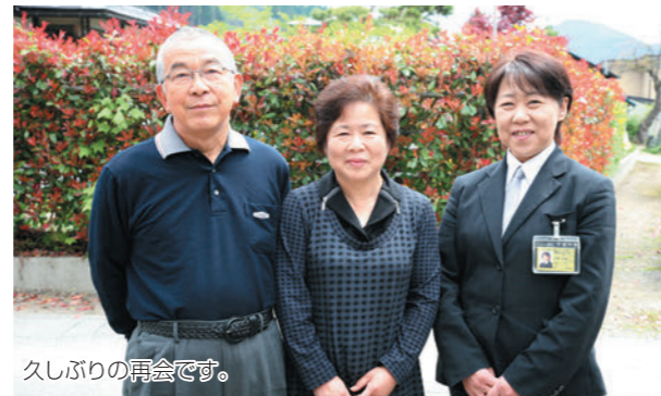
久しぶりの再会です。

母の葬儀は昨年一月でした。大正生まれの母は、大変な苦勞をしてきた人です。若い時には福島に行商などで通いながら、私たち子供を育ててくれたので、長男の私には特に思い入れが強かったと思います。とても気丈な人でした。少しでも親孝行をとこうと、年をとってからは、「二世帯住宅」で気ままに好きなように暮らしてもらいました。家内が趣味で「アメリカンフラワー」の制作をもう12年くらい続けていて、いろいろな展示会や講習会などをやらせていただいています。が、自宅にもたくさん作品が飾ってあります。お客様が家に来られた時には、よく母もいろいろと嬉しそうに説明してあげたりしていました。知り合いの方からのご依頼で、お仏壇に飾る蓮の花やカサランカをアメリカンフラワーで作って欲しいと頼まれて、作ったりしています。季節を問わずお好きなお花をお供えできるので、母のお仏壇にもいつもお花を飾ってあげたいと思