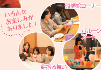
似顔絵コーナー いろいろな楽しみがありました!

当日は、互助会やご葬儀についてのご相談も承りました。日頃気がかりなことや疑問に思うことなど、お話し頂きます。