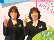
互助会のご相談も承ります