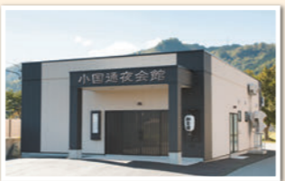
●全館バリアフリー ●冷暖房完備 ●Wi-Fi完備 ●大型駐車場完備