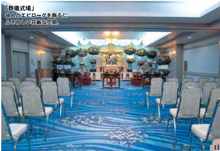
「葬儀式場」 故人のエピソードを飾るに ふさわしい荘厳な空間。